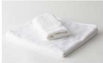
バスタオル・フェイスタオル